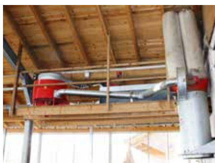
Unité de transfert et aspirateur