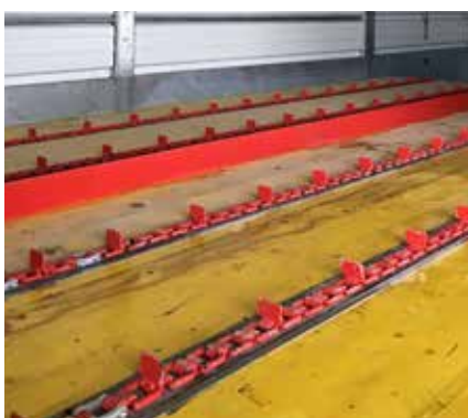
Table de stockage de balles

Une table de stockage peut être ajoutée au démêleur pour stocker plusieurs balles. La table de 4 modules a une capacité de stockage d'env. 1.600 kg de paille et celle de 6 modules env. 2.400 kg. La table convient aux balles rondes, balles carrées et aussi à la paille en vrac. Les balles ou la paille en vrac sont chargées automatiquement dans le démêleur.